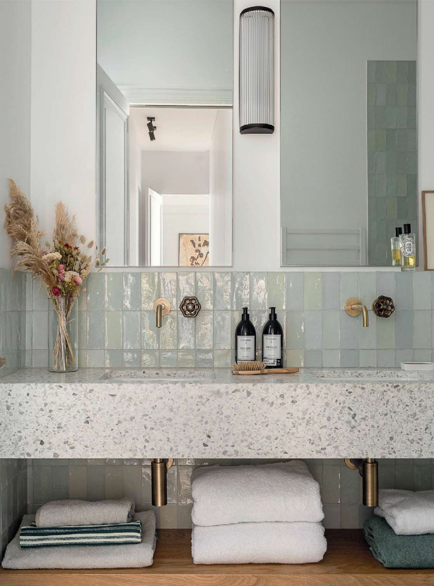
Douceur pastel dans la salle de bains des enfants, du carrelage "Fez", Wow Design, au terrazzo, Sola9. Vasques, Duravit. Robinets, Neve. Applique, Astro Lighting. Miroirs sur mesure, Ferraris.